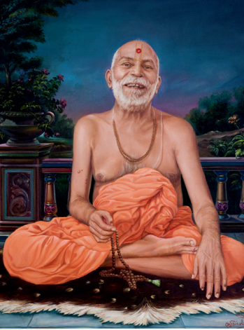
બ્રહ્મસ્વરૂપ યોગીજી મહારાજ